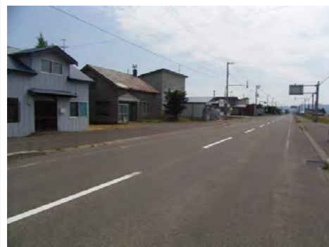
前面道路南西方向