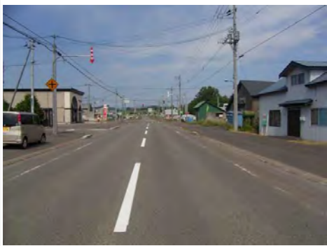
前面道路北東方向