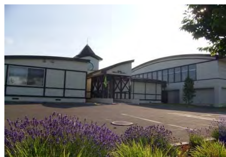
西部地区コミュニティセンター