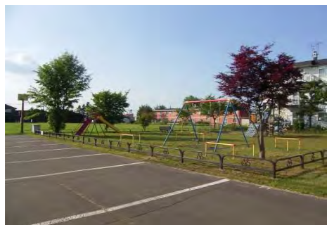
西部地区コミュニティ広場