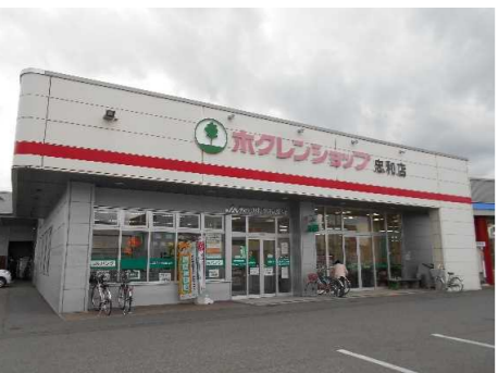
ホクレンショップ・JAあさひかわ

JR旭川駅より西方向へ順路約5.8Kmに位置し、周辺は一般住宅が 建ち並ぶ住宅街の一角です。 北向きの角地で敷地は83坪とゆったりしております。 旭川新道まで約400mで各方面へのアクセスも良好です。 現在建物がありますが、解体更地渡しとなります。