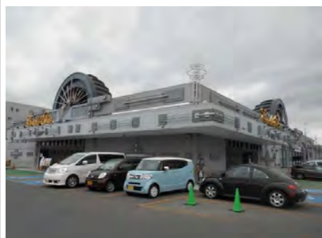
コーチャンフォー

旭川駅前、フィールより東方向へ約1.2Km 1条本通りに面する間口10.9mの南向きの敷地です。 国道39号線につながる大雪通まで約33m、永山方面や神居方面へのアクセスも良好です。 近隣にはビッグやツルハがある宮前ショッピングセンター、法務局や中税務署が入る旭川合同庁舎、銀座通り商店街、各病院、銀行等が集まるJR旭川四条駅も徒歩圏です。