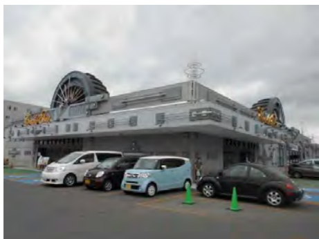
コーチャンフォー

旭川駅前、フィールより1条本通りを東方向へ約1.2Km 2条通りとの仲通りに面する北向きの敷地です。 国道39号線につながる大雪通まで約70m、永山方面や神居 方面へのアクセスも良好です。 近隣にはビッグやツルハがある宮前ショッピングセンター、法務 局や中税務署が入る旭川合同庁舎、銀座通り商店街も徒歩圏です。 各病院、銀行等が集まるJR旭川四条駅まで約350m、徒歩 約4分です。